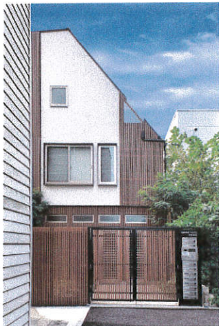
グランエッグス武蔵新田

東急多摩川線「武蔵新田」駅 徒歩7分 東急多摩川線「矢口渡」駅 徒歩9分 木造 3階建(平成29年竣工) 住居10戸